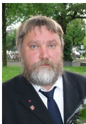
Urmass Sisask (1960)